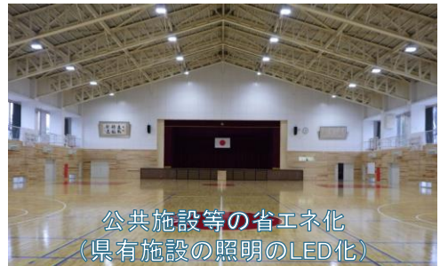
公共施設等の省エネ化 (県有施設の照明のLED化)