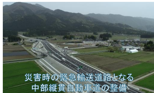
災害時の緊急輸送道路となる 中部縦貫自動車道の整備