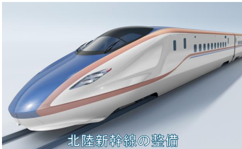
北陸新幹線の整備