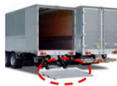
【荷役作業の省力化機器(イメージ)】