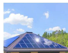
【太陽光発電(イメージ)】

〔太陽光と蓄電池のセット導入 補助上限額：60.5万円 太陽光の単独導入 補助上限額：25万円〕