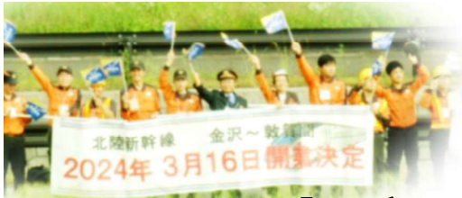
越前たけふ駅周辺