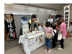
【お城イベント(イメージ)】

〔 県内外の関係団体(自治体・観光協会・城郭管理団体等)によるブース出展 著名人による講演やトークセッション 県内各地のお城イベントとの連携開催(巡回バスの運行) 〕