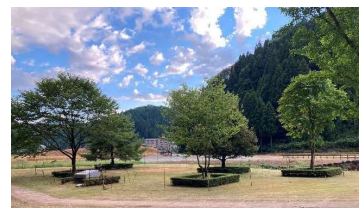
【会場：一乗谷朝倉氏遺跡】

〔開催日 令和6年10月19日(土)、20日(日) 会場 お手入れ行事 一乗谷朝倉氏遺跡 式典行事 サンドーム福井〕