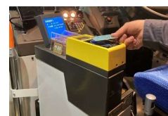
【バスの交通系ICカード】

交通系ICカード利用者が路線バスを半額で乗車できるキャンペーン (令和6年3月16~31日の全日、4~5月の土日祝日) 無料で乗車できる「バス無料デー」(令和6年秋期)