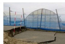
【地震により被災したハウス】

〔補助率:再整備 国1/2以内、県1/3(共済未加入の場合は、1/4) 撤去 国1/2以内、県1/3〕