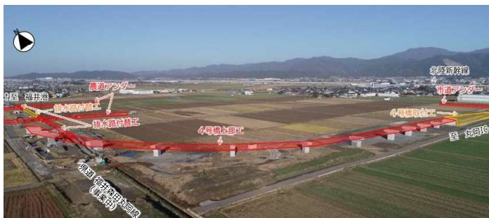
【福井港丸岡インター連絡道路】2,420百万円

道路・河川・砂防ダム・港湾の整備 等 ほ場・農業用施設・漁港・治山ダムの整備 等