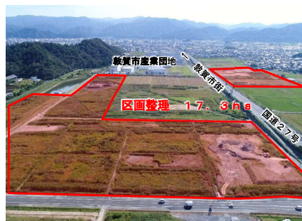
【ほ場整備 敦賀西部地区】462百万円