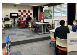
【会社説明会(イメージ)】