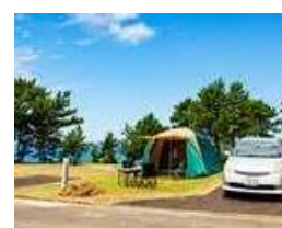
【オートキャンプ(イメージ)】