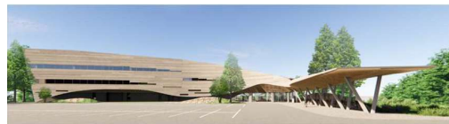
【新学部棟(イメージ)】