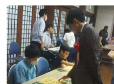
【将棋イベント(イメージ)】

〔 対局にあわせ、県内の観光PR広告を掲載 プロ棋士との多面指し、朝倉象棋(しょうぎ)体験教室等を開催 〕