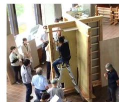
【低コスト工法講習会の様子】