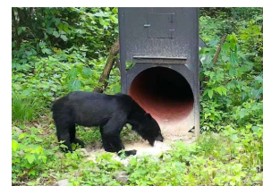
【ツキノワグマの捕獲(イメージ)】

出没状況や生息密度分布を反映した高精度な個体数推定 檻の運用方法を示した捕獲技術マニュアルの整備 等