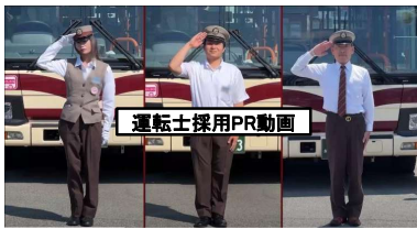
【運転士採用PR動画(イメージ)】