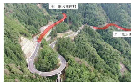
【坂本高浜線(おい町石山)】