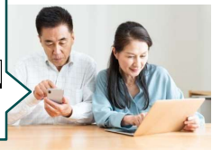
【親へのアドバイス(イメージ)】