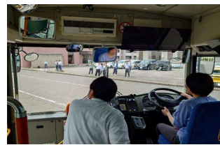
【大型二種免許の取得支援(イメージ)】