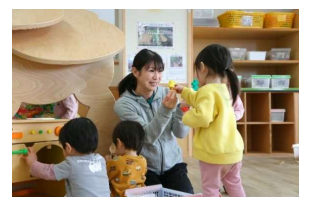
【こどもの成長を支える保育者(イメージ)】