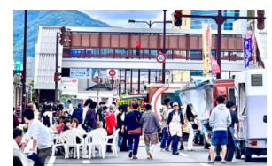
【消費喚起イベント(イメージ)】

〔補助上限額〕 ※市町を通じた間接補助 計画策定に対する支援 200万円 緊急的な消費喚起事業に対する支援 2,000万円