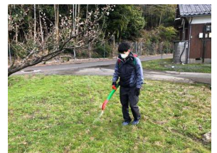
【梅の施肥の様子(イメージ)】