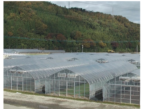
【施設園芸用ビニールハウス】