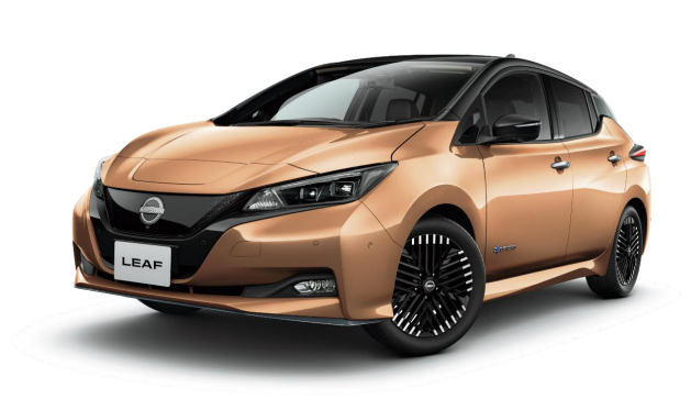
【電気自動車 (イメージ)】