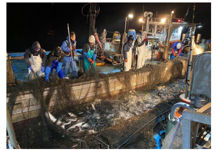
【漁船漁業(イメージ)】