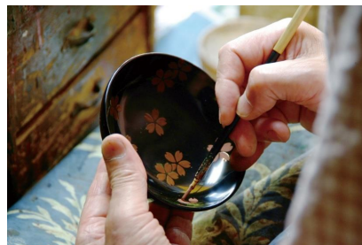
【越前和紙製作風景(イメージ)】 【越前漆器製作風景(イメージ)】