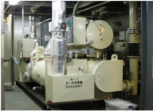
【エネルギー効率の良いターボ冷凍機 (イメージ)】