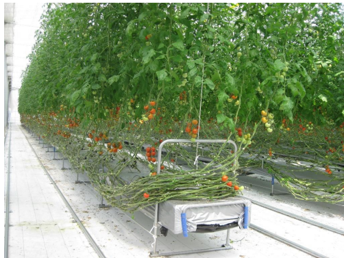
【施設園芸 (イメージ)】