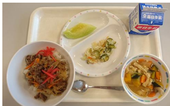
【学校給食 (イメージ)】