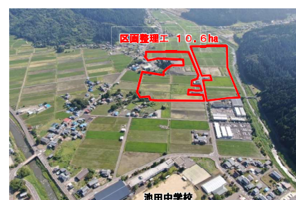
【区画整理工(池田町)】 (経営体育成基盤整備事業)