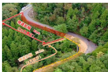
【坂本高浜線(おおい町石山)】 (現道拡幅)