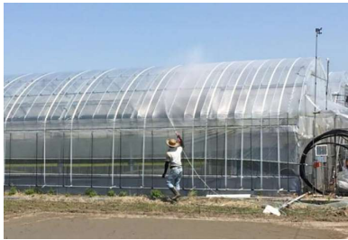
【遮熱剤散布(イメージ)】