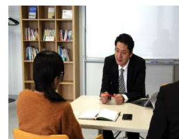
【専門家相談(イメージ)】

「取引適正化サポーター(中小企業診断士など)」の派遣などにより、県内全域で価格交渉・価格転嫁を促進