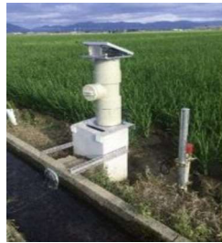
【自動給水栓(イメージ)】