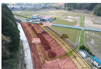
【七瀬川(福井市内山梨子町～大年町)】 (河道掘削)