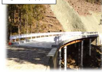
橋梁工完成(舗装未了) 西側から東方向を望む