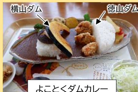
よことくダムカレー