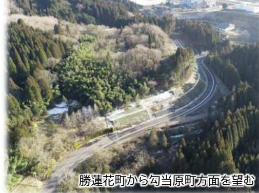
勝蓮花町から勾当原町方面を望む