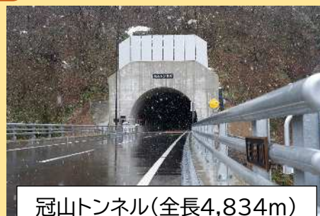
冠山トンネル(全長4,834m)

横山ダム近くの道の駅では、両ダムをイメージした「よことくダムカレー」を食べました。将来は、吉野瀬川ダムのダムカレーを食べてみたいと思います。地元の飲食店の皆様、ご検討いただければ幸いです。