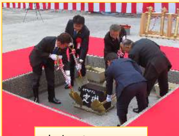
ちんてい 鎮定の儀