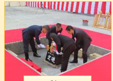
いみづち 齋槌の儀