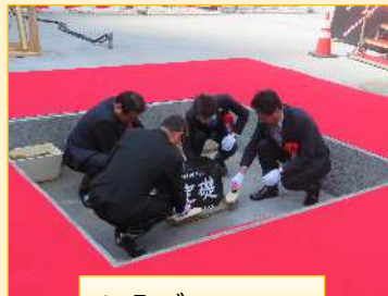
いみごて 齋鐔の儀