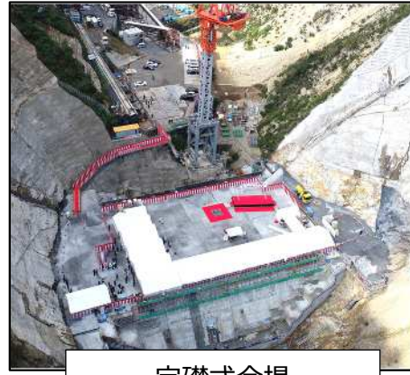
定礎式会場 (下流側上空から撮影)