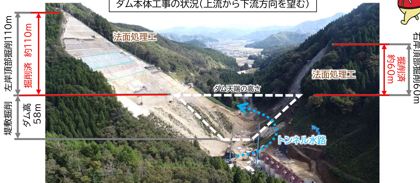
ダム用仮設備の設置