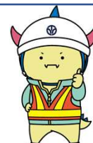
マスコットキャラクター 「土木版はぴりゅう」

発行者 吉野瀬川ダム建設事務所 〒915-0872 越前市広瀬町113-5 ☎(0778)21-0020 【お問い合わせは上記へ】