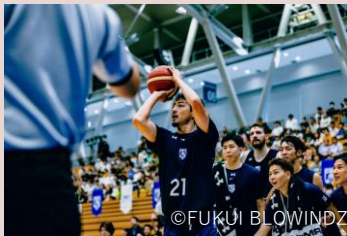
福井ブローウィンズ(バスケットボール)

内容：「FUKUI RAYS」全体への支援のほか、チームを指定して支援することも可能