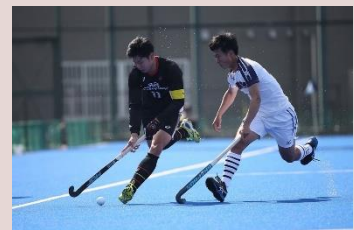
福井工業大学男子ホッケー部