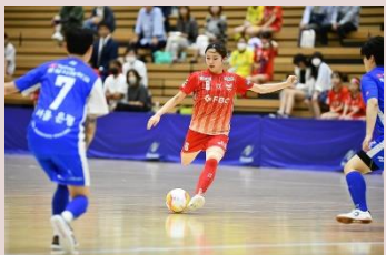
福井丸岡RUCK(女子フットサル)