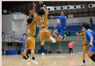
福井永平寺ブルーサンダー(ハンドボール)