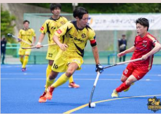
ヴェルコスタ福井(ホッケー)