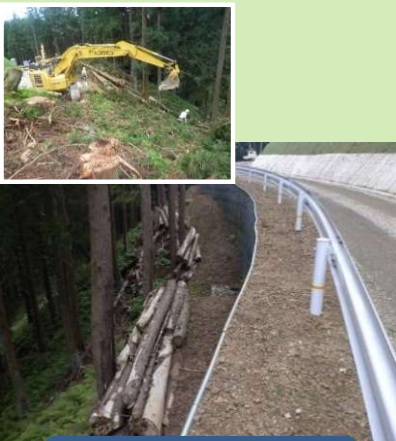
支障木の集積状況

工事で発生した支障木を枝払い、玉伐いし、景観を損なわないよう整理、集積しました。