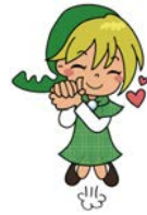
魅力 ディスカちゃん