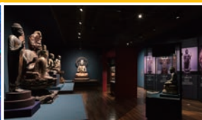
若狭歴史博物館 (小浜市)