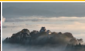
天空の城 越前大野城 (大野市)