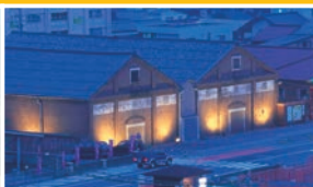
赤レンガ倉庫 (敦賀市)