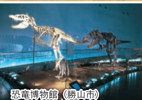
恐竜博物館 (勝山市)