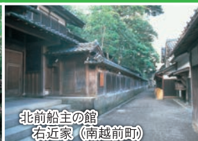
北前船主の館 右近家 (南越前町)