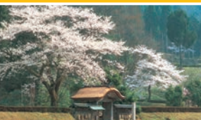
一乗谷朝倉氏遺跡 (福井市)