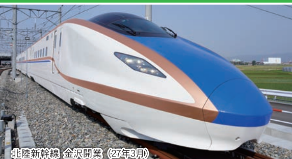
北陸新幹線 金沢開業 (27年3月)