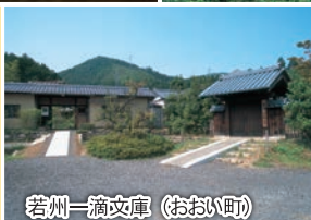
若州一滴文庫 (おおい町)