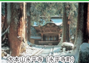
大本山永平寺 (永平寺町)