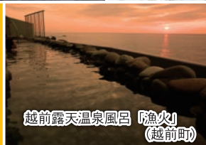
越前露天温泉風呂「魚火」 (越前町)