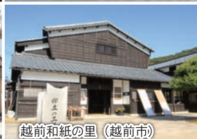
越前和紙の里 (越前市)