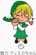
魅力 ディスカちゃん