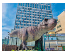
福井駅周辺の恐竜スポット