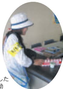
配達業務を活かした 子供の見守り活動