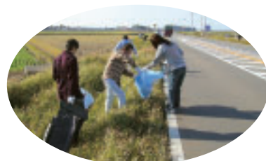
企業ぐるみの清掃活動