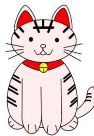
広報マスコット たんにゃん

女性のがん検診(子宮がん検診・乳がん検診)を 1検診あたり2,000円/人補助 します