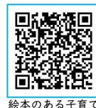
絵本のある子育て