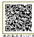
本のあるまいにち