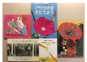
分かりやすく書かれたLLブック