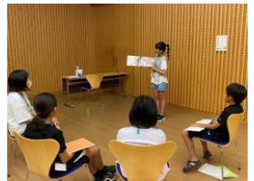
子どもが子どもに読み聞かせ