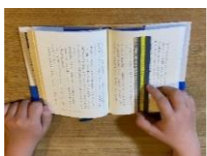
リーディングトラックを 使っている様子

障がいのある子ども、日本語指導を必要とする子ども等、多様な子どもの可能性を引き出すための読書環境を整備します