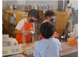
ジュニア司書養成講座 カウンター体験