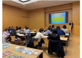
学校図書館活用研修