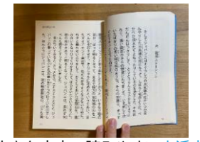
大きな文字で読みやすい大活字本