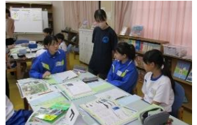
学校図書館での授業