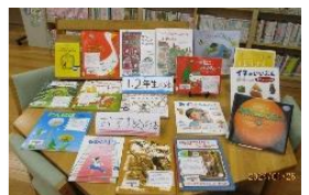
小学校での推奨図書展示