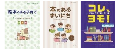
推奨図書小冊子 幼児編 小学生編 中高生編