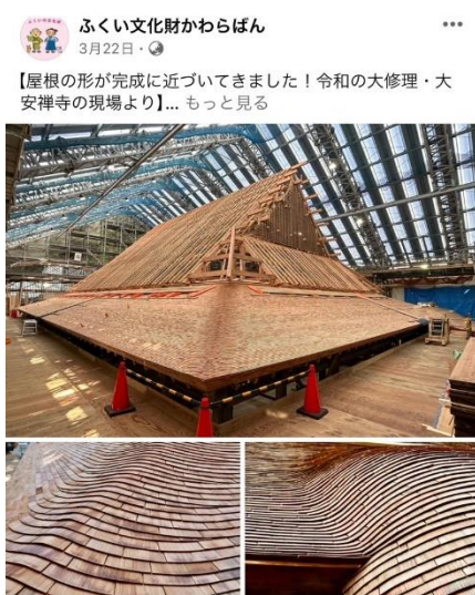
Facebook では詳しく丁寧に投稿

フォロワーも着実に増えています。今後、YouTubeでの動画発信も行っていく予定です。