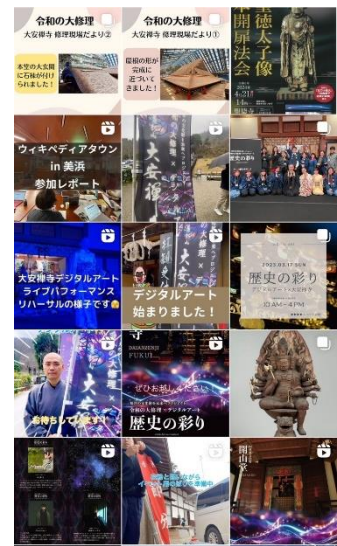
Instagram はビジュアル重視