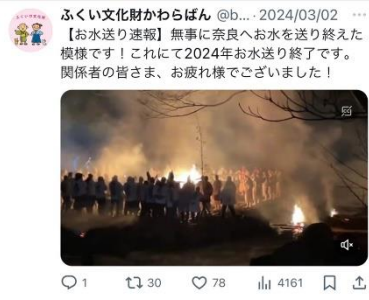
X ではリアルタイムな発信も！