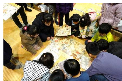
大盛り上がりの宝探し