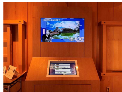
福井城等の映像展示