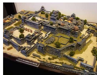
ジオラマのイメージ