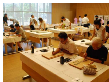
山里口御門復元整備募金 壁板記名会