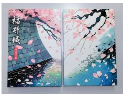
福井城御城印帳 (募金やふるさと納税の返礼品)