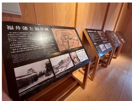
歴史紹介等のパネル展示