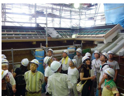
山里口御門工事説明会