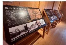
山里口御門内の展示