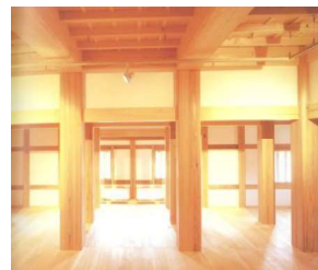
柱割等の構造展示(新発田城三階櫓)