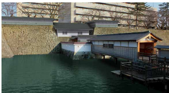
山里口御門の復元予想図