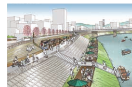
仮設デッキ等の整備イメージ