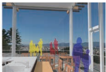
展望白山テラスに設置するカフェのイメージ