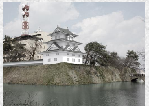
坤櫓・西側土堀の復元予想図

坤櫓は、当時の規模を再現し、高さ約16mで復元する計画です。復元後は福井駅から見えるようになります。