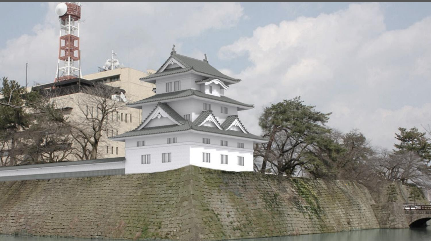
坤櫓、本丸西側土塀復元イメージ