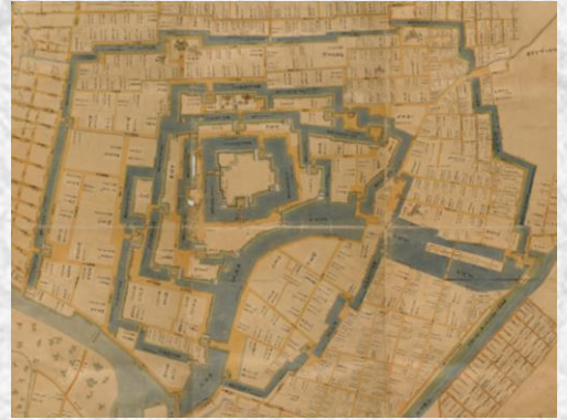
「福居御城下絵図」 (松平文庫 福井県文書館保管)

明治以降、櫓や城門は取り壊され、四重五重の水堀も徐々に埋められましたが、本丸の石垣と内堀は400年以上たった今も現存しています。