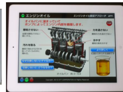
タブレット端末による説明