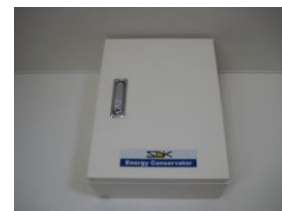
省電力監視制御盤