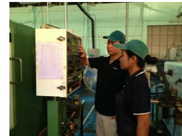
(B-AMC の工場内／タイ人と日本人が一緒に働いている写真)