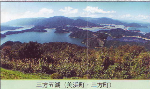
三方五湖 (美浜町・三方町)