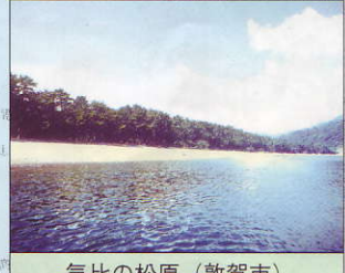
気比の松原 (敦賀市)