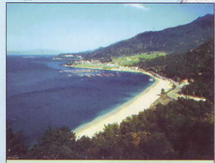
敦賀半島の海岸線 (敦賀市)