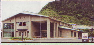
福井県海浜自然センター (三方町)

三方町食見地区は若狭湾国立公園内にあり、周辺の浅海域は素晴らしい海中公園景観に恵まれていることから海中公園地区に指定されています。福井県海浜自然センターは、人と自然との共生をめざし、豊かな海の自然を知り、自然の尊さや大切さを感じ、体験するための施設です。