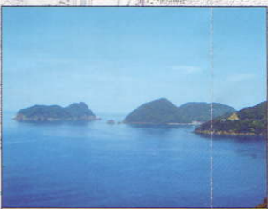
三方海中公園地区1号 (三方町)

三方町食見地区は若狭湾国立公園内にあり、周辺の浅海域は素晴らしい海中公園景観に恵まれていることから海中公園地区に指定されています。福井県海浜自然センターは、人と自然との共生をめざし、豊かな海の自然を知り、自然の尊さや大切さを感じ、体験するための施設です。