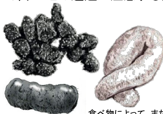
ツキノワグマの糞