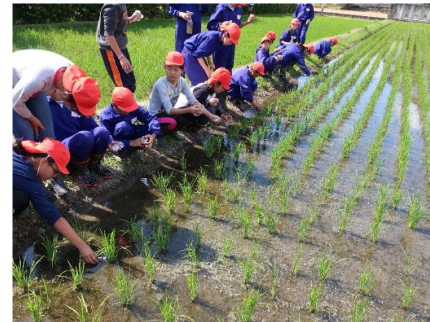
ミジンコを小瓶に収集