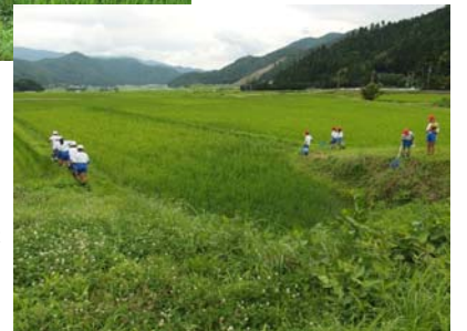
コウノトリが飛来する田んぼでのカエル調査