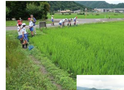
学校田でのカエル調査