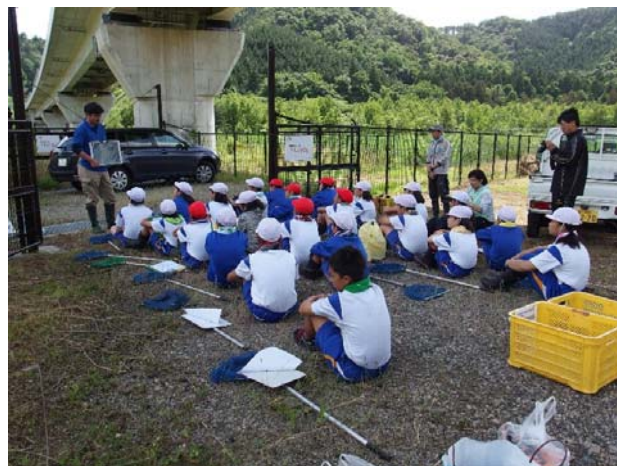
外来種についてのお話

6月2日及び12日には、5・6年生が2班に分かれて、かや田に生育する外来の植物を記録したり、外来種捕獲かごで捕獲された外来種（ウシガエル、ミシシッピアカミミガメ）を観察したりしました。