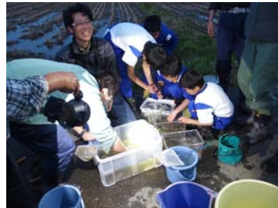
捕まえたメダカをみんなで観察