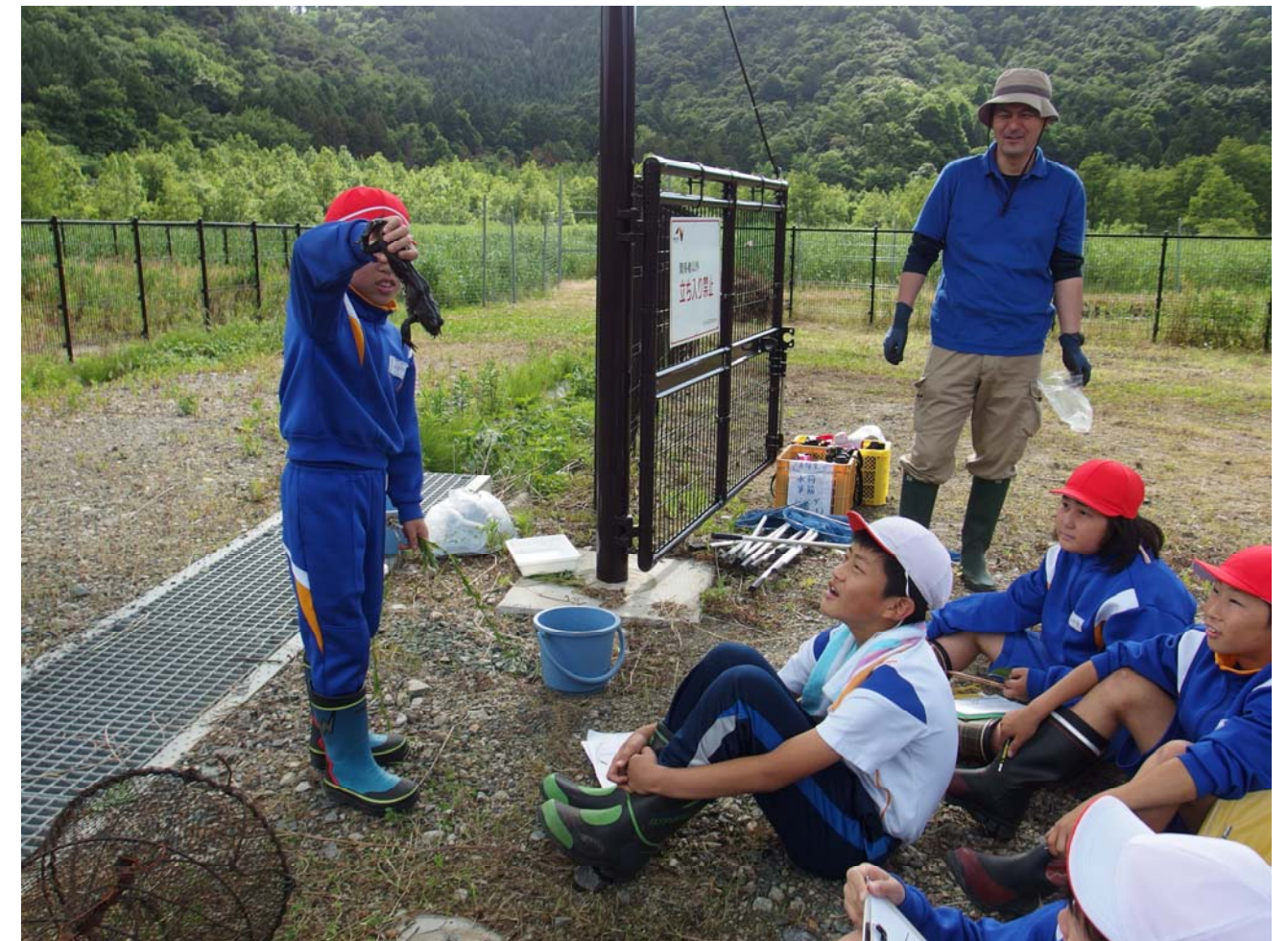
気山小学校・かや田の外来種調査