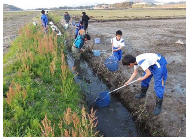
水路でのメダカ探し

4月28日に、日本野鳥の会福井県とハスプロジェクト推進協議会の協働で、「メダカ救い作戦@久々子湖畔」が実施されました。「メダカ救い作戦」とは、久々子湖畔で進められている田んぼの改良工事現場の水路に生息するメダカを一時的に避難させ、工事完了後に、生息環境が整ったところを見計らって、再度、現地に放流する試みです。