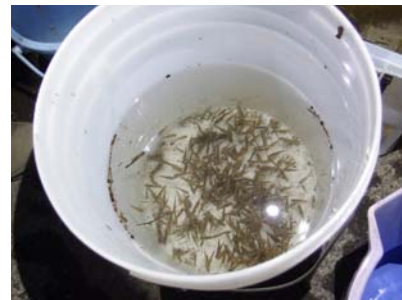
みんなで捕まえたメダカ

今回の救出作戦には、地元の子どもたちと仕事帰りの地域の方が集まり、タモ網を使ってメダカを捕まえました。捕まえたメダカは、参加者がそれぞれ持ち帰り、工事が終わる来春まで育てることにしています。