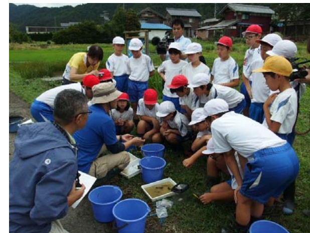
カエルの見分け方を学習

7月5日には、室内で“田んぼの生きものつながり”についての学習をした後、学校田のカエル調査をし、7月14日には、コウノトリが飛来した田んぼ等でのカエル調査をしました。調査後には、カエルの見分けができるようになったり、カエルが苦手だった子がカエルに触れるようになったりしました。