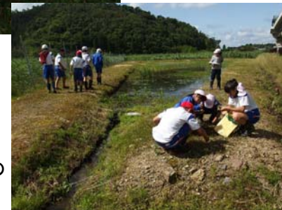
確認した外来種の記録