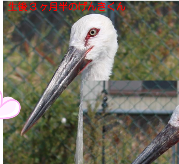
生後 3 ヶ月半のげんきくん