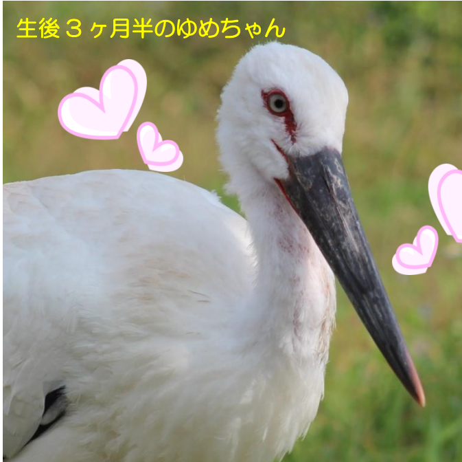
生後 3 ヶ月半のゆめちゃん

という声が大多数です。でも毎日毎日毎日毎日コウノトリを見ていると、「ゆめちゃんが特別童顔だ」ということが分かってきました。これは去年の 9 月 30 日、ゆめちゃん生後 3 か月半の写真です。2 日違いの兄貴たちの顔と見比べてください。