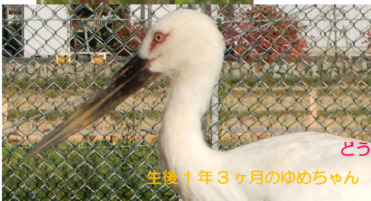
生後 1 年 3 ヶ月のゆめちゃん