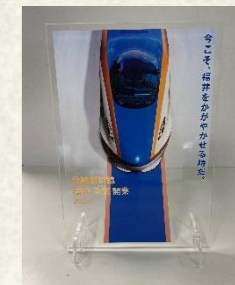
アクリルパネル（イメージ）