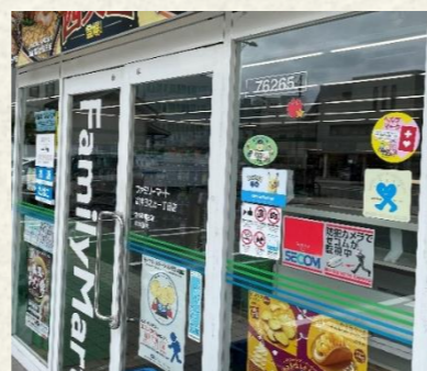
ファミリーマート

青山美工堂、カガセイフン、ゲストHOUSE Loungeたき、JA福井県女性組織協議会、大安寺中学校創立70周年事業実行委員会、THAP（タップ）、ニュークリーン公社、日の丸タクシー、ファミリーマート各店、ミズエ、やまちよ