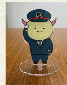
はぴりゅう（新幹線ver）アクリルスタンド（イメージ）