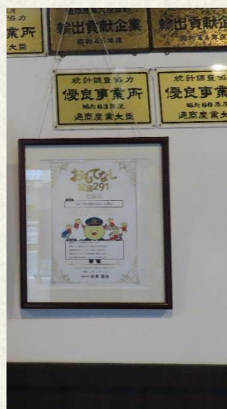
はたや記念館ゆめおーれ勝山

アイシン福井、アイビス高島、アルプスカメラ、田舎家ほぐし処ひまわり、越前信用金庫、越前焼工業協同組合、大久保茶屋、カガセイフン、ゲストHOUSE Loungeたき、心に響く文集・編集局、坂井市竹田農山村交流センター ちくちくぼんぼん、白山交通、松風荘あらや、信越化学工業武生工場、人道の港敦賀ムゼウム、生児栄養薬品若狭工場、そばはうすえびすや、タイヨー各店、大和交通、THAP（タップ）、力組、肉研、二光技建、ニュークリーン公社、農村de合宿キャンプセンター、はたや記念館ゆめおーれ勝山、日の丸タクシー、福井育英センター、福井銀行各支店・ふくジェンヌ、福井県米穀、POLAミナミ、マルカワみそ、民宿 あおきや、明光建商各支店、明和工業、やまちよ