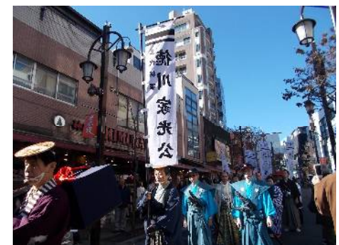
神楽坂でのPRイベント