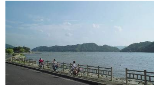
三方五湖サイクリングロード（既設区間）