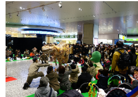
首都圏主要駅でのPRイベント