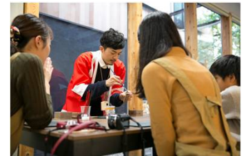
工房見学イベント「RENEW」