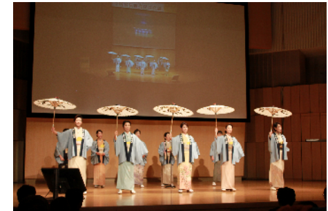
金沢開業時の全国宣伝販売促進会議