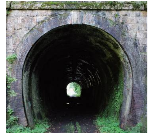
旧北陸線トンネル