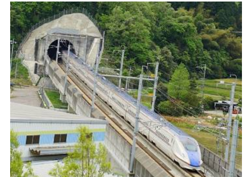
走行する新幹線（イメージ）