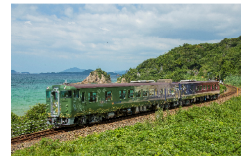
観光列車（イメージ）