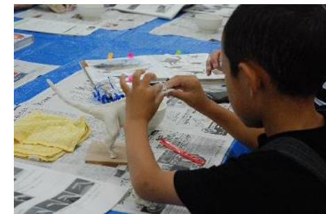
恐竜レプリカづくり