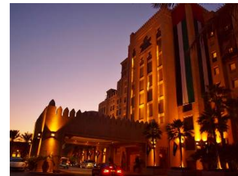
高級ホテル（イメージ）