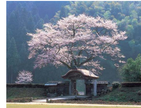
一乗谷朝倉氏遺跡