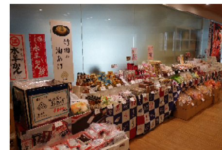
企業内での物産展