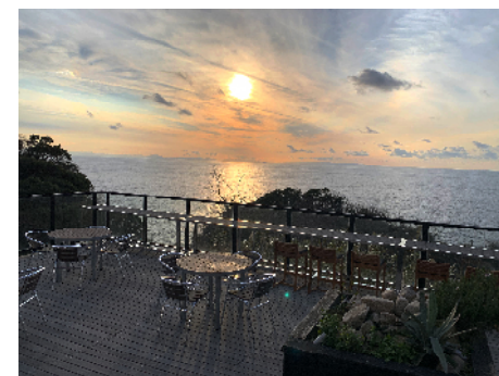
インスタグラマー写真