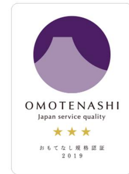
おもてなし規格認証