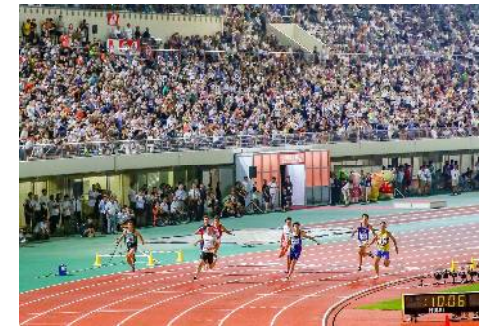
アスリートナイトゲームズ（2019.8）