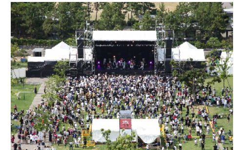
ワンパークフェス