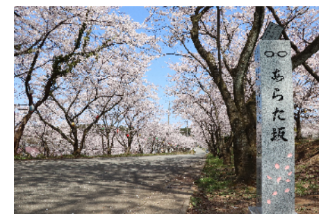
「ちはやふる」ゆかりの地