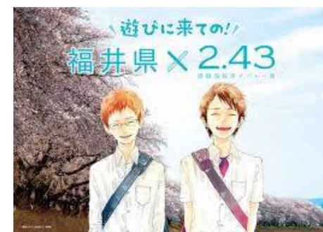
小説「2.43 清陰高校男子バレー部」 ©壁井ユカコ/山川あいじ/集英社