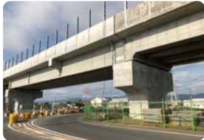
工事のようす 森田高架橋(福井市)

橋きやくとよばれる大きな柱にけたをのせて組み立てます。柱と柱の間かくを長くできるので、道路をまたぐところなどに使われます。