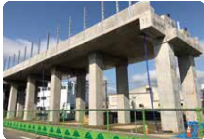
工事のようす 福井高柳高架橋(福井市)

いくつもの柱と柱をはりで一体的につなげてつくります。変形に強く、多くの高架橋がこの形になっています。