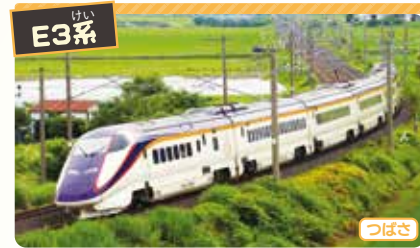
E3系 (最高速度 新幹線区間:時速275km 在来線区間:時速130km)

★三二新幹線は、新幹線から在来線に直接乗り入れるので、普通の新幹線車両より長さや幅が小さくなっています。