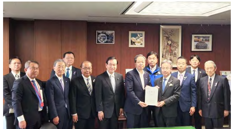
国土交通大臣への要請