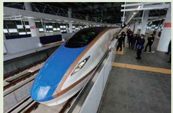
▲敦賀駅に到着した北陸新幹線

北陸新幹線の敦賀・新大阪間の開業は、 日本全体の災害対策 という意味合いもあるのだ。