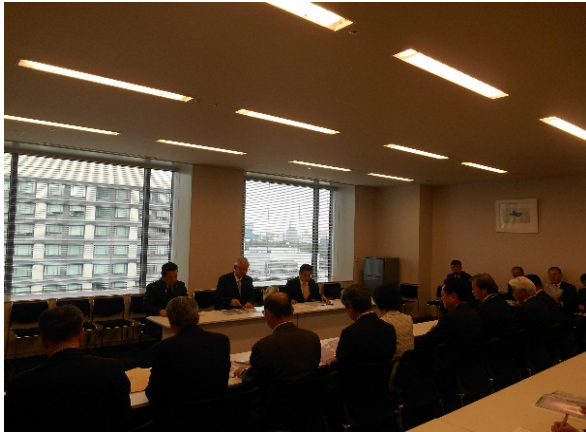
井上公明党幹事長(衆Ⅱ1018号会議室)