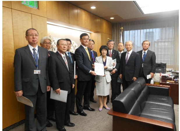
森屋総務大臣政務官(政務官室)