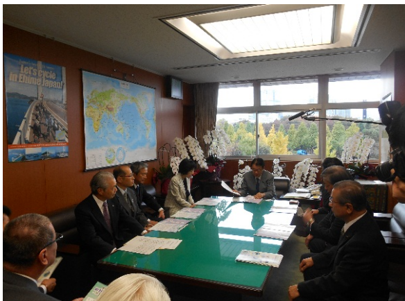
山本国交副大臣(副大臣室)