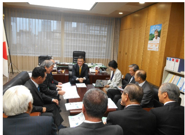
森屋総務大臣政務官(政務官室)