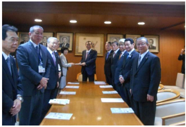
細田自民党幹事長代行(自民党本部総裁応接室)