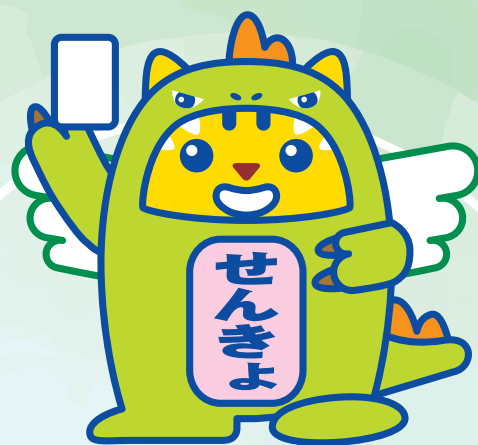
めいすいサウルス (福井県ご当地めいすいくん)

みんなが投票に行きたくなるような キャッチフレーズや標語を募集するよ。 たくさん応募してね！