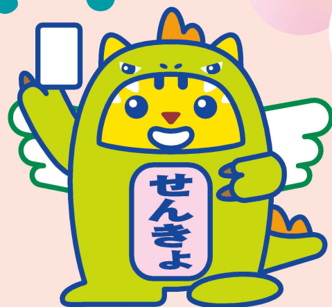
めいすいサウルス (福井県ご当地めいすいくん)

みんなが投票に行きたくなるような キャッチフレーズや標語を募集するよ。 たくさん応募してね！