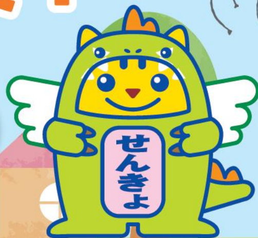
めいすいサウルス (福井県ご当地めいすいくん)

みんなが投票に行きたくなるような キャッチフレーズや標語を募集するよ。 たくさん応募してね！