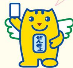
選挙のめいすいくん (明るい選挙のイメージキャラクター)

日本の未来を担う若い世代の声をより政治に取り入れるため、70年ぶりに法律が改正されて、平成28年7月に行われた参議院議員通常選挙から選挙権年齢が18歳以上に引き下げられました！！