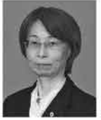
最高裁判所判事 岡村和美 昭和三十三年二月三日生

裁判官としての心構え 事件に多角的な観点からアプローチし、その背景事情や経緯などから、裁判で取り上げられている紛争や事件の実態や真相を十分に把握し、それに適合する解決方法を考える。現在、新型コロナウイルス感染症の影響により社会的な状況が急変し、多岐にわたる事件が起きている。今後、予想されることも多岐にわたる。より柔軟な姿勢で事件に向き合っていく必要がある。また、最高裁判所は、書面審査が基本ですが、法廷で論議の期日が開かれる事件では、当事者(代理人)による活発な弁論がなされるよう工夫を凝らしています。また、法廷で論議する際には、当事者(代理人)の主張を十分に聴き、その工夫努力を認めていくことも必要です。