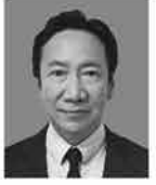
最高裁判所判事 草野耕一 昭和三十三年三月三日生

裁判官としての心構え 事件に多角的な観点からアプローチし、その背景事情や経緯などから、裁判で取り上げられている紛争や事件の実態や真相を十分に把握し、それに適合する解決方法を考える。現在、新型コロナウイルス感染症の影響により社会的な状況が急変し、多岐にわたる事件が起きている。今後、予想されることも多岐にわたる。より柔軟な姿勢で事件に向き合っていく必要がある。また、最高裁判所は、書面審査が基本ですが、法廷で論議の期日が開かれる事件では、当事者(代理人)による活発な弁論がなされるよう工夫を凝らしています。また、法廷で論議する際には、当事者(代理人)の主張を十分に聴き、その工夫努力を認めていくことも必要です。