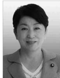
社民党 福島みずほ