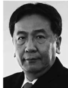
立憲民主党 代表 枝野幸男