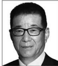
代表 松井 一郎