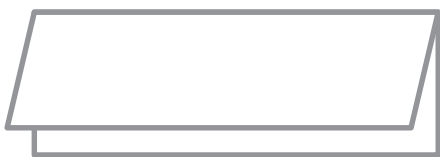
①縦に半分に折ります