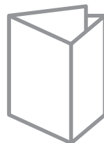
④三角に折り残りの1面を中に差します