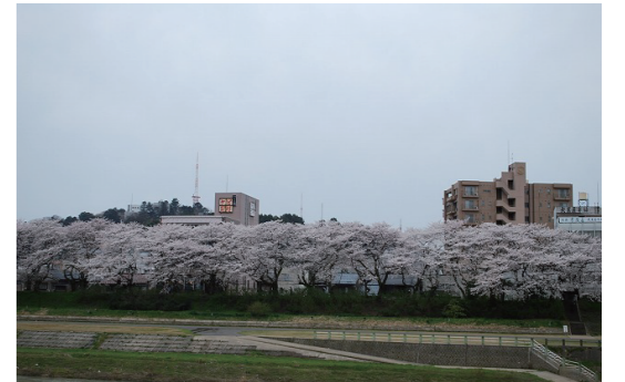
浜町側から眺める足羽川・桜並木・足羽山