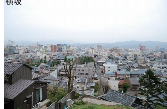
展望台からまちを望む