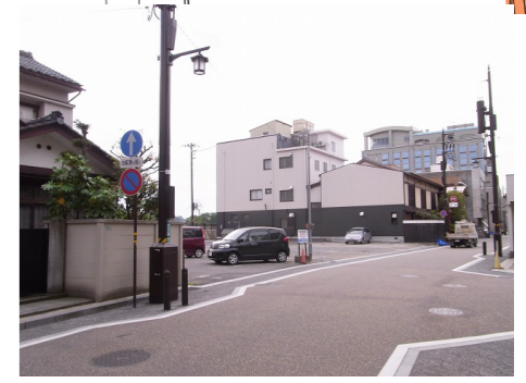
まち並みを壊している青空駐車場