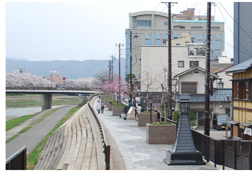
足羽川の高水敷 (さくらの小径)