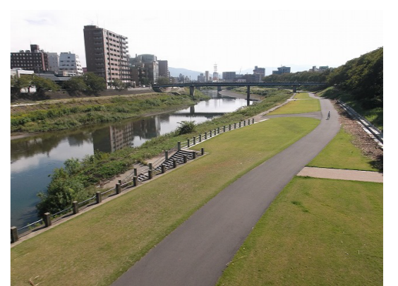
足羽川のジョギング・サイクリングコース