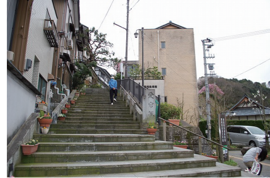
古来から参道として栄えた愛宕坂