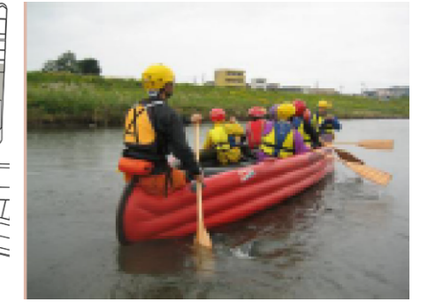
足羽川を使ったボートイベント