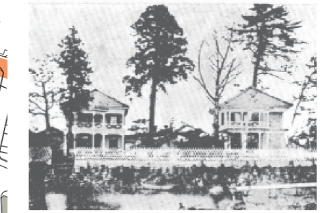
在りし日の異人館