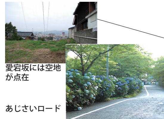
愛宕坂には空地が点在