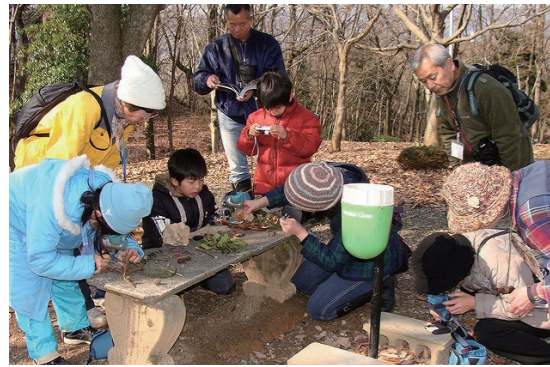
全国植樹祭 (H21) に向けて開催された足羽山の自然観察会