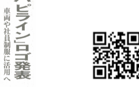
ハピラインふくいHP↑