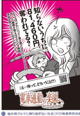
福井県クルマに頼り過ぎない社会づくり推進県民会議

ガソリン価格の高騰を受け、電車通勤への乗り換えを促進する広報キャンペーンを開始しました。漠然と訴求するのではなく、ターゲットを「20代後半～40代後半の子育て世代」に絞り込み、「こんなに損してるかも」という表現を多角的に展開。デザインの力も活用し、従来にない広報を実現しました。