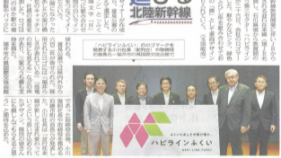
日刊県民福井2面[R4.8.27掲載]

「ハピラインふくい」のブランディングにクリエイターが参画しています。社名やロゴマークだけでなく、会社のパーパス（存在価値）を社員と徹底的に議論。「ふくいと明日の架け橋に。」というコピーを構築し、社員間の意識の共有化を図りました。