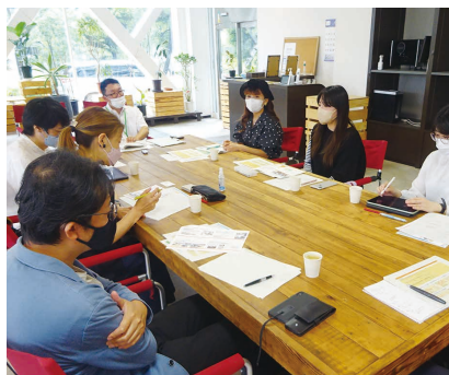
学生団体の方と意見交換