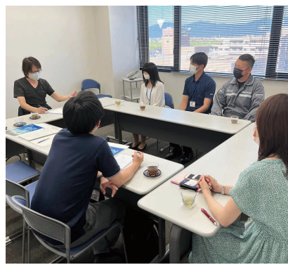
企業に訪問し新入社員の方にヒアリング

県外の大学に進学した学生のUターン就職は3割弱。深刻化する県内企業の人材不足改善に向けて、新規卒業者に県内企業への就職に関心を持ってもらう新たなアプローチを探るべく、県内企業にUターン就職した新入社員との意見交換を実施しました。県内企業4社を回り、若い