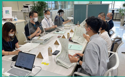
パブリックデザインラボふくいにて

また、庁内でワークショップを行える場として、未来戦略課内に「パブリックデザインラボふくい」を設置。机や座席をゆったり配置した開放的な空間の中で、活発な議論やアイデアの創出を促しています。