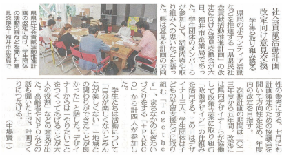
日刊県民福井3面[R4.6.7掲載]

県が策定する各種計画にも政策デザインの仕組みを活用しています。今年6月には、県内クリエイター3名が学生団体やシニア世代との計画改定に向けた意見交換会に参加し、ボランティア活動者の生の声を聞くことができました。今後、促進のための要因について議論しながら方向性を定め、年度内の改定を目指していきます。