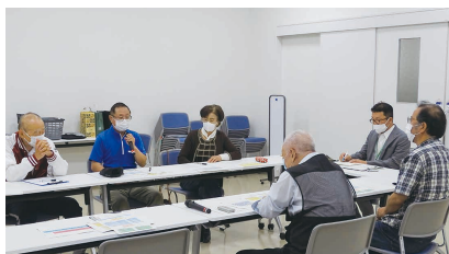
シニア世代の方と意見交換