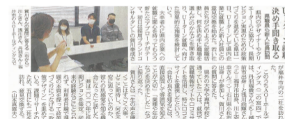
日刊県民福井2面[R4.7.3掲載]

県外の大学に進学した学生のUターン就職は3割弱。深刻化する県内企業の人材不足改善に向けて、新規卒業者に県内企業への就職に関心を持ってもらう新たなアプローチを探るべく、県内企業にUターン就職した新入社員との意見交換を実施しました。県内企業4社を回り、若い