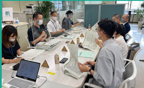
パブリックデザインラボふくいにて

また、庁内でワークショップを行える場として、未来戦略課内に「パブリックデザインラボふくい」を設置。机や座席をゆったり配置した開放的な空間の中で、活発な議論やアイデアの創出を促しています。