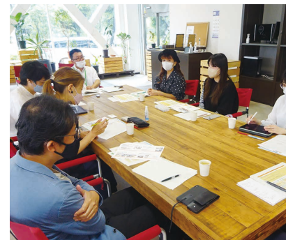
学生団体の方と意見交換

県が策定する各種計画にも政策デザインの仕組みを活用しています。今年6月には、県内クリエイター3名が学生団体やシニア世代との計画改定に向けた意見交換会に参加し、ボランティア活動者の生の声を聞くことができました。今後、促進のための要因について議論しながら方向性を定め、年度内の改定を目指していきます。