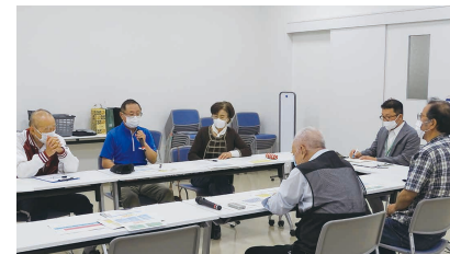
シニア世代の方と意見交換