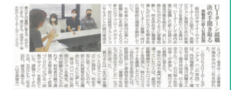
日刊県民福井2面[R4.7.3掲載]

県外の大学に進学した学生のUターン就職は3割弱。深刻化する県内企業の人材不足改善に向けて、新規学卒者に県内企業への就職に関心を持ってもらう新たなアプローチを探るべく、県内企業にUターン就職した新入社員との意見交換を実施しました。県内企業4社を回り、若い