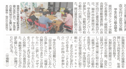
日刊県民福井3面[R4.6.7掲載]