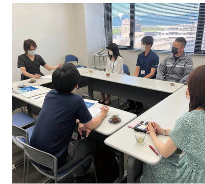
企業に訪問し新入社員の方にヒアリング