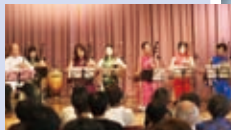
アールフォー団(二胡)