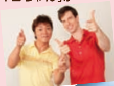
バックンマックン