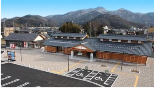
重点道の駅「若狭おばま」バスターミナル整備

○ 2023年度実施事業【福井県】 市町と連携した観光地周辺の景観整備(嶺南振興プロジェクト枠予算(ハード事業)150,000千円の内数)