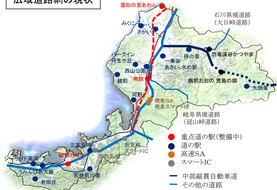
広域道路網の現状