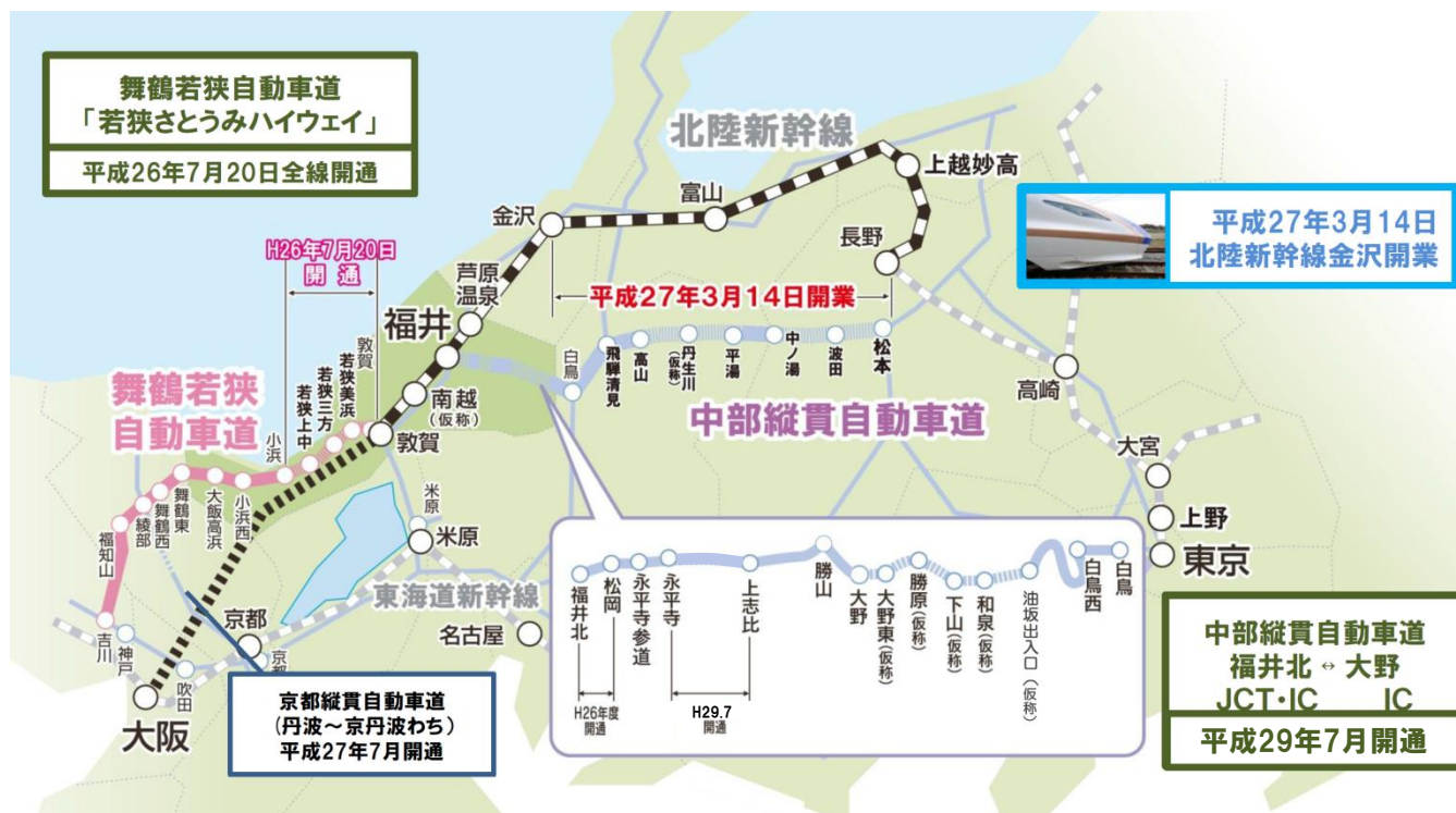
地域ブランド力調査の結果(令和元年10月)

また、平成27年3月には、北陸新幹線が金沢まで開業し、福井県と首都圏とのアクセスが「東海道回り」と「北陸回り」の環状新幹線ルートの形成が進みました。