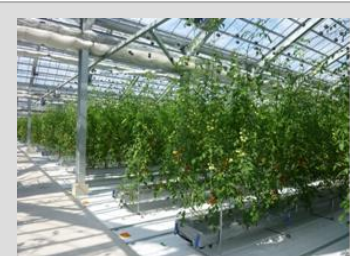
低廉な電力供給を活かした周年型大規模園芸施設・植物工場