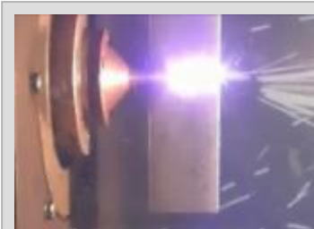
エネルギー研究開発拠点として培われたレーザー技術の産業分野への応用展開