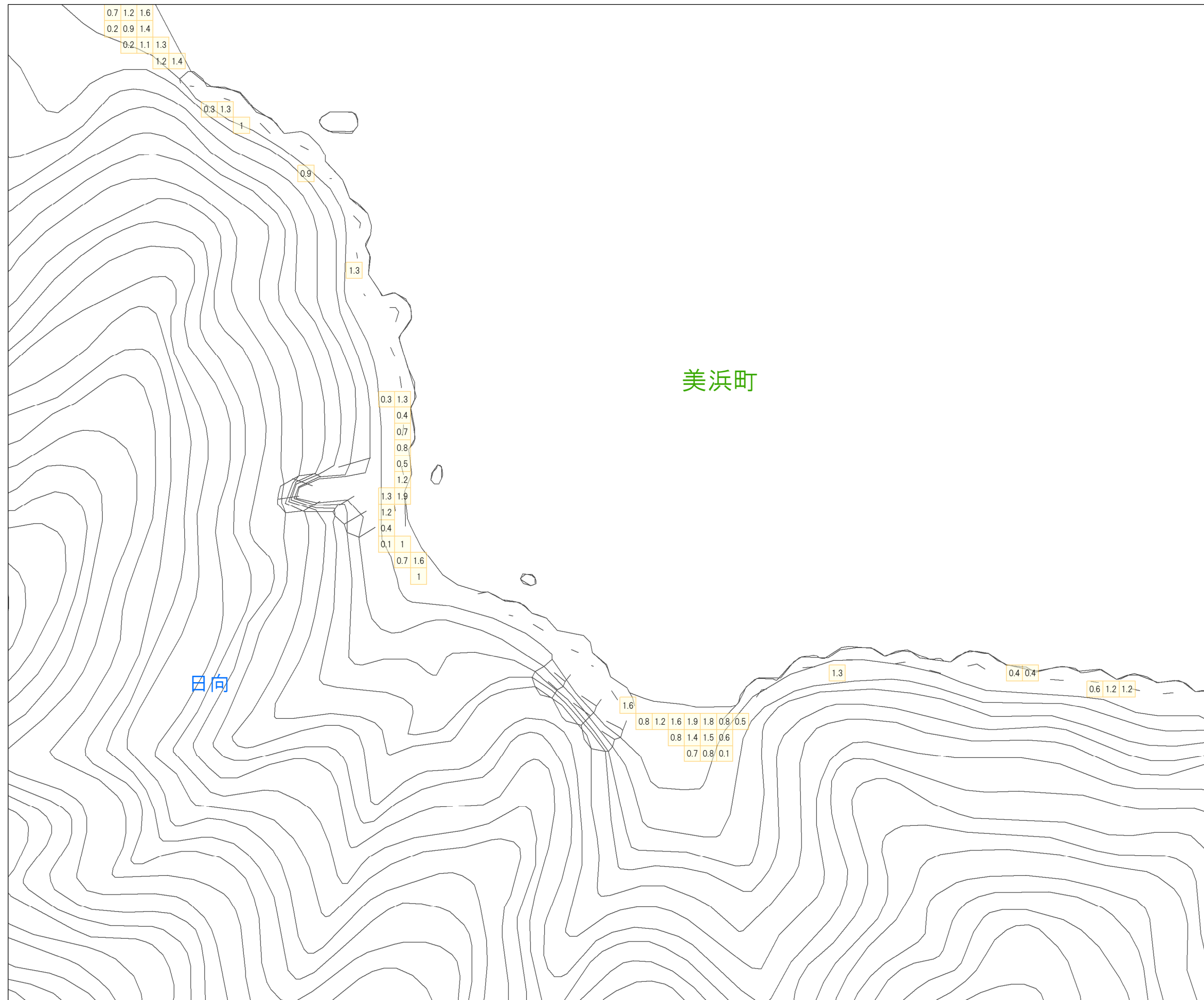
津波災害警戒区域 区域図