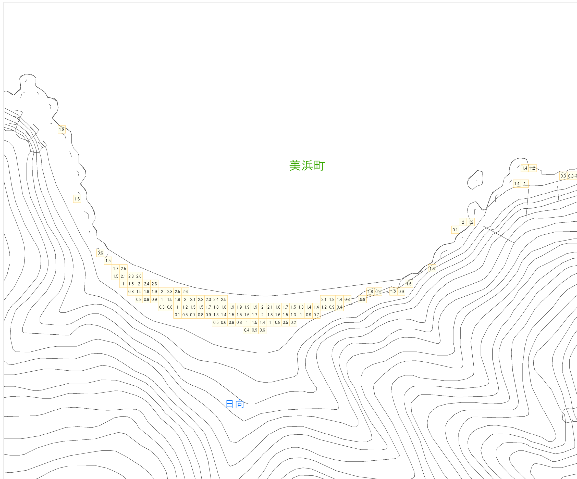
津波災害警戒区域 区域図