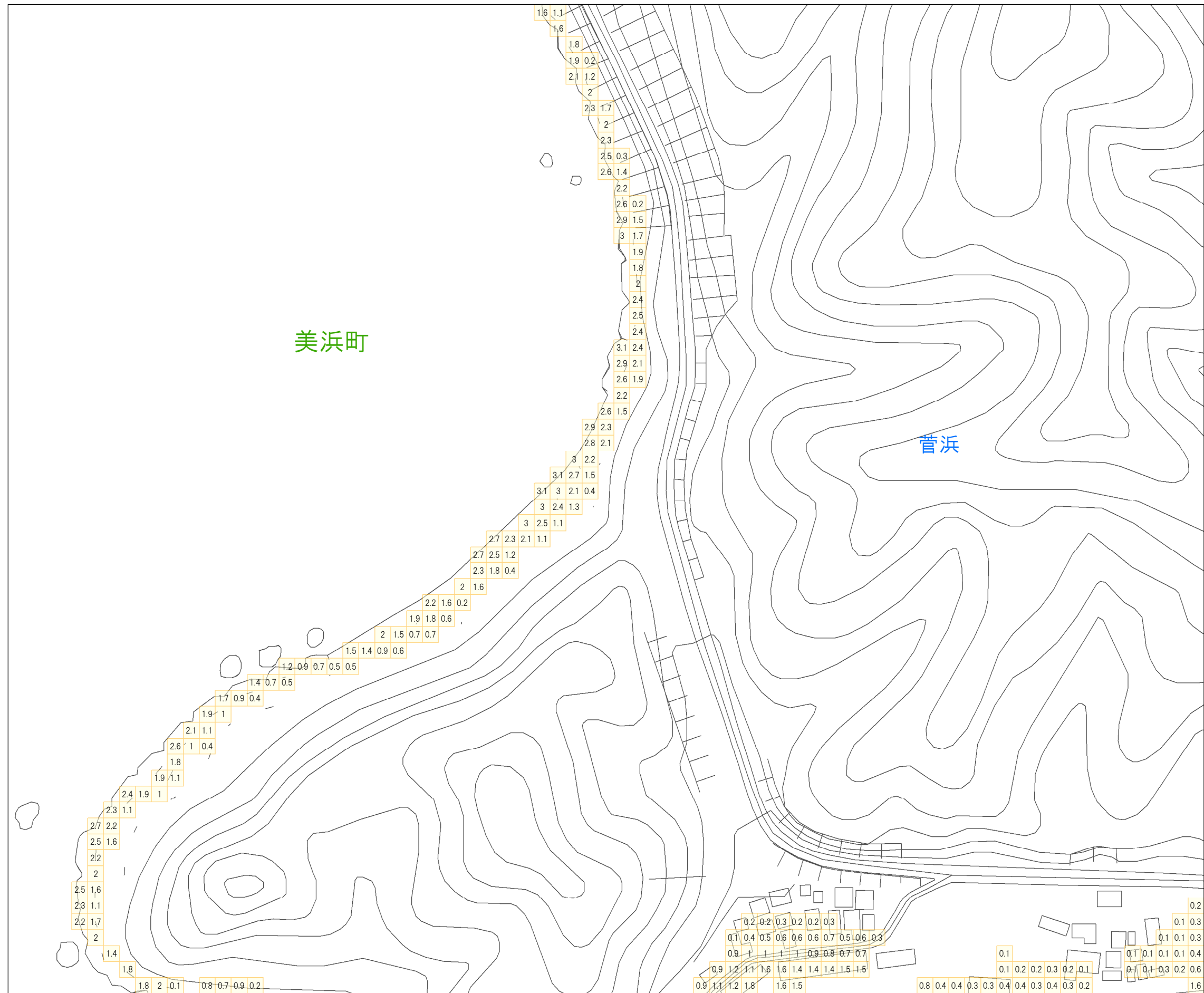
津波災害警戒区域 区域図